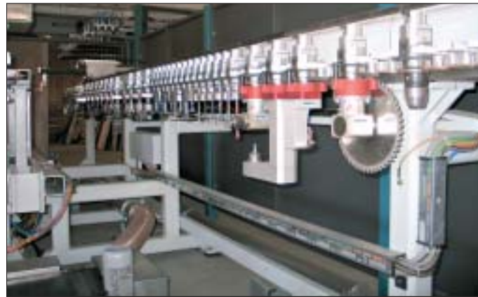
Abb. 8 Werkzeuge mit Späneleitblechen