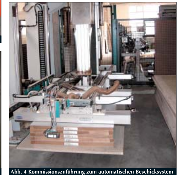
Abb. 4 Kommissionszuführung zum automatischen Beschickungssystem

zentralen Leitstand aus vom Maschinenführer bedient (Abb. 3). Das zu bearbeitende Material wird kommissionsweise bereitgestellt und dem automatischen Beschickungssystem zugeführt (Abb. 4). Jedes Werkstück wird durch den Barcode-Scanner erfasst und die dazugehörigen Daten für die Bearbeitung dieses Werkstückes werden aktiviert. Die Anlage ist dazu geeignet, Werkstücke von min. 300 x 800 mm und max. 1400 x 3 500 mm mit einer Dicke bis 80 mm zu bearbeiten. Das Beschickungssystem nimmt das Werkstück vom Stapel und legt es auf die Zentrierstation (Abb. 5). Aus dieser Position wird dann der nächste freie Bearbeitungstisch bestückt. Der dazugehörige Datensatz für die Bearbeitung wird geladen und der Bearbeitungstisch fährt unter das Festportal mit den Bearbeitungs-, Bohr- und Fräsaggregaten