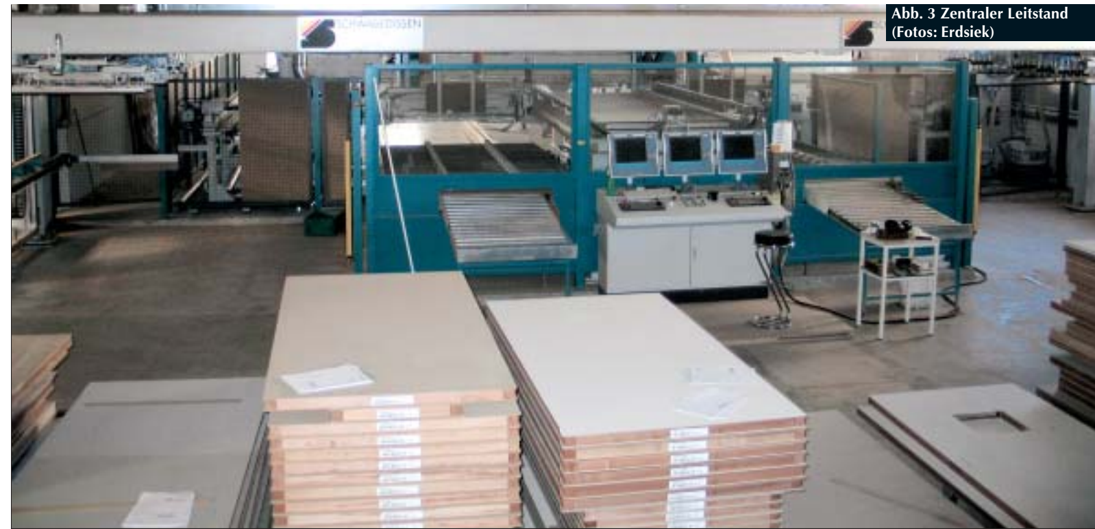
Abb. 3 Zentraler Leitstand

Unter dem Motto „Door Solutions“ bietet die Jeld-Wen Schweiz AG das umfangreichste und kompletteste Türsortiment im Schweizer Markt. Vom Standort Bremgarten aus wird die gesamte Marktverantwortung für alle Aktivitäten der Türen-Gruppe in der Schweiz wahrgenommen. Dies beinhaltet neben der Eigenproduktion Kellpax auch die bekannten Türenmarken Wirus, Moralt, Dana und Kilsgaard. Zusammen kommen damit ca. 250 000 Türen p. a. aus der Jeld-Wen-Gruppe auf den Schweizer Markt. Traditionell werden noch ca. 8 000 Werkbank- und Arbeitstischplatten in jeder gewünschten Form und den verschiedensten Ausführungen in Bezug auf Größe, Dicke und Kante produziert. Das spezielle, verschleißfeste Deckschichtmaterial „Urphen“ wird in eigener Produktion hergestellt. Rund 75 gut qualifizierte Mitarbeiter beschäftigt das Werk Bremgarten derzeit, es verfügt über einen modernen Maschinenpark, der, im Zu-