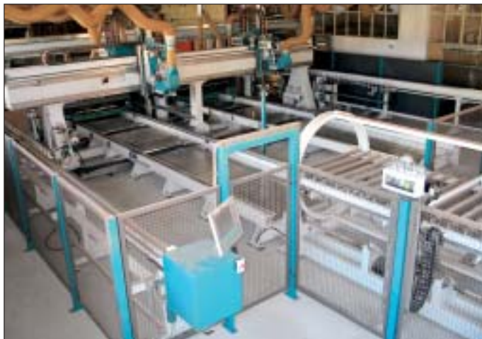
Abb. 6 Positionierter Bearbeitungstisch

(Abb. 6). Der Bearbeitungstisch ist mit automatisch positionierenden Saugerreihen ausgerüstet. Luftdüsen an jedem Sauger reinigen diesen nach einem Fräsvorgang. Bei beidseitiger Flächenbearbeitung des Werkstückes, wird durch einen Trommelwender das Werkstück um 180° gedreht. Am Festportal sind vier Fräs- und Bohrspindeln angeordnet, welche die jeweiligen Bearbeitungen durchführen. Die am Motorsupport angeordneten Werkzeuge sind in X und Y positionierbar und um ca. 100° schwenkbar. Jede Bewegung wird über NC-Achsen gesteuert.