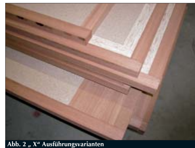
Abb. 2 „X“ Ausführungsvarianten

u. a. um MDF und Hartfaserplatten, roh, beschichtet, lackiert mit Alu-Blech verstärkt oder auch mit Alu-Oberfläche, je nach Anforderung und Design.