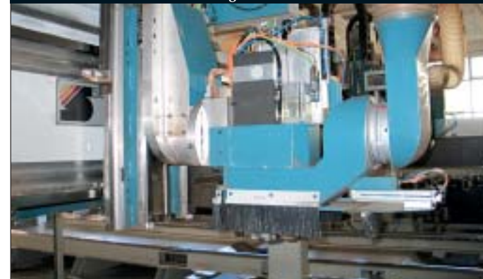
Abb. 7 Z-Achsen-Positionierung

zur Verfügung stehen. So steht bei zeitlich unterschiedlichen Bearbeitungsvorgängen immer der nächste freie Bearbeitungstisch für das neue Werkstück bereit. Auch bei eventuellen Störungen oder Wartungsarbeiten stehen immer noch 50% der Anlagenkapazität weiterhin zur Verfügung. Um die Rüstzeiten zu minimieren, haben die Bearbeitungssupporte Zugriff auf zwei Werkzeugwechsellmagazine, mit Platz für jeweils 100 Fräs- und Bohrspindeln. Entscheidend wichtig ist, dass sämtliche spanabhebenden Werkzeuge mit Späneleitblechen ausgerüstet sind. Dadurch konnten die Reinigungszeiten auf ein Minimum reduziert und die Produktivität auf einem markant hohen Niveau gehalten werden (Abb. 8). Nach Beendigung des Bearbeitungsvorganges positioniert der Bearbeitungstisch unter dem Abstapelsaugwagen. Auf dem