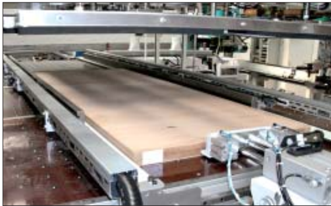
Abb. 5 Werkstückablage-Zentrierstation