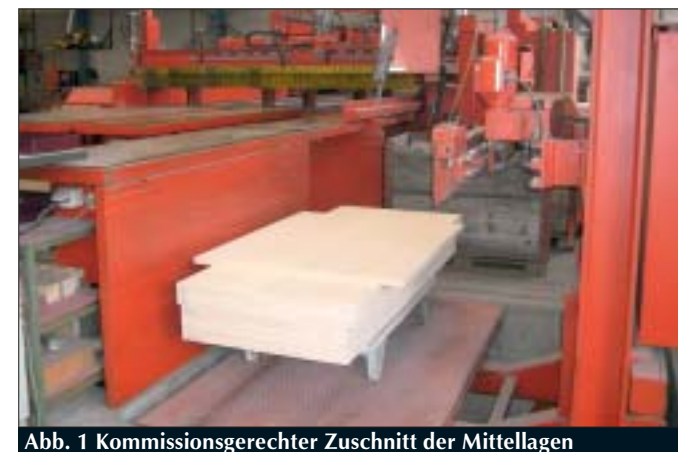
Abb. 1 Kommissionsgerechter Zuschnitt der Mittellagen

der Oberflächenbehandlung verfahren und der fertigen Tür, respektive dem montagebereiten Tür-Element (Abb. 1). Die Mittellagen mit den unterschiedlichsten Formaten erhalten danach auf einer vollautomatisch arbeitenden Anlage die passenden Kanten. Mittellagen und Kanten werden mittels Linearroboter zusammengeführt und miteinander verleimt. Die Herausforderung besteht auch hier darin, die richtigen Kanten zum richtigen Zeitpunkt den unterschiedlichsten Türgrößen, Türtypen und Kommissionen zuzuordnen. Je nach Type der Tür gibt es hier „X“ Ausführungsvarianten (Abb. 2). Die so hergestellten Mittellagen werden geschliffen und auf drei Verleimpresen mit Deckschichten versehen. Auch hier werden kommissionsbezogen die Deckschichten bereitgestellt. Der Aufbau der Türen muss den unterschiedlichen Typenklassen und dem Oberflächendesign entsprechen. Bei den Deckschichten handelt es sich